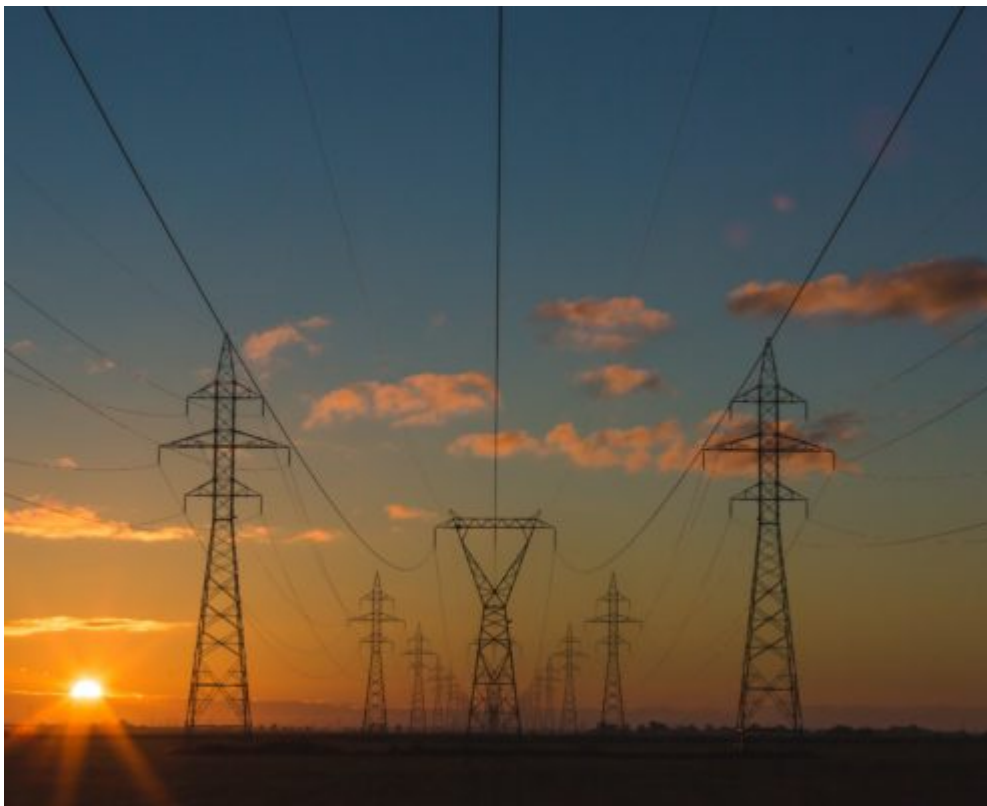
Energiemanagement - Vom Klimaschutz zum Selbstschutz