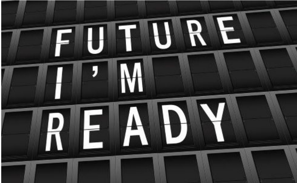
Mittelstand: attraktiv trotz Herausforderungen