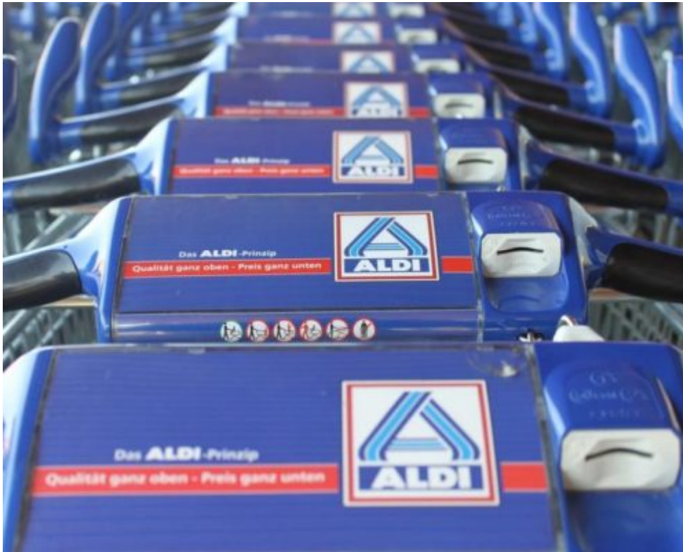
Inside Aldi: Werbesprecher im Realitätscheck